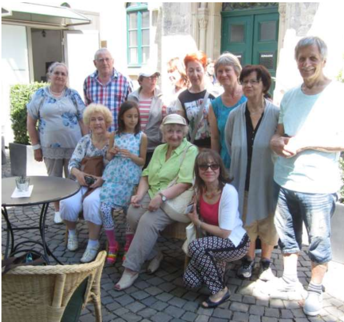
Часть нашей группы перед музеем