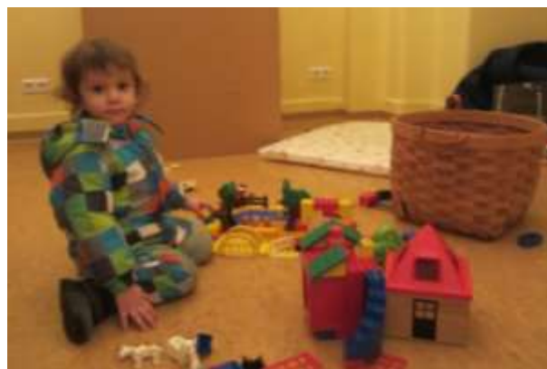
Маленькая Орли играет с леги