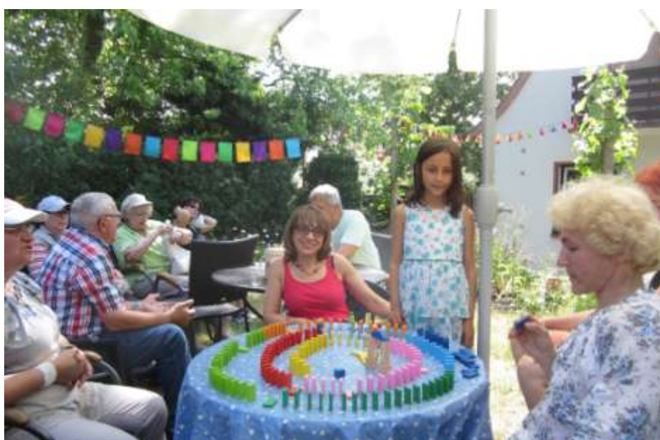
Отдых и пикник в саду