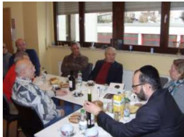
Дискуссия с раввином в Школе ТИФТУФ