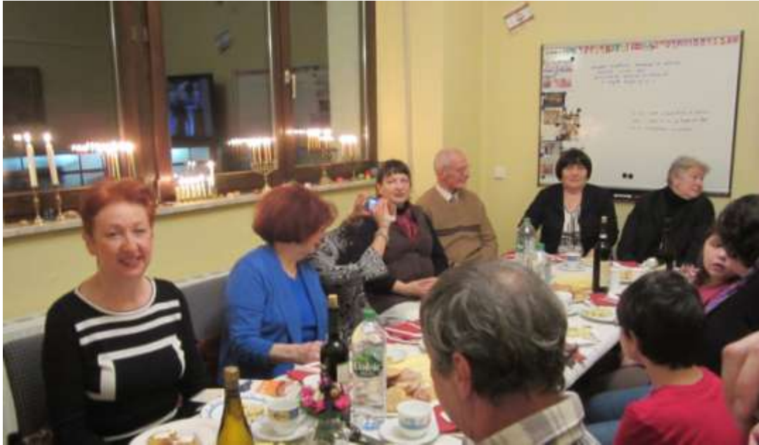
Приятная атмосфера при горящих светильниках Ханукки