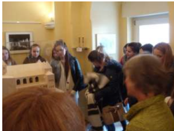
Школьницы у модели синагоги Бингена

„Я хочу жить, жить, как другие, и радоваться жизни...“