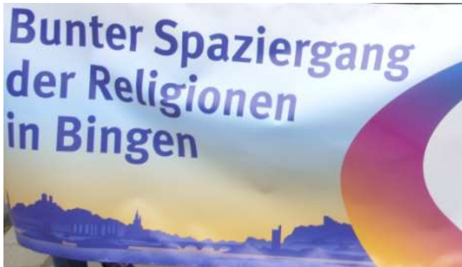
На плакате написано: Разноцветная прогулка религий по Бингену