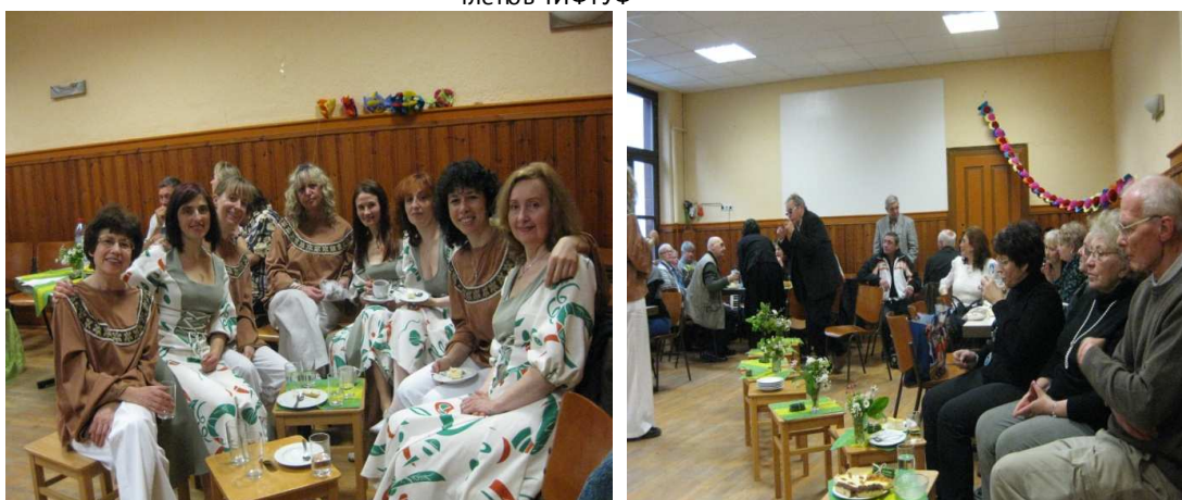
Израильская группа народных танцев из Франкфурта